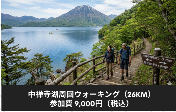
中禅寺湖周回ウォーキング (26KM) 参加費 9,000円 (税込)