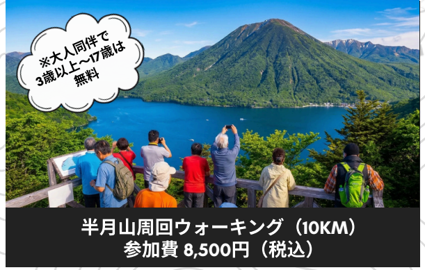
半月山周回ウォーキング (10KM) 参加費 8,500円 (税込)