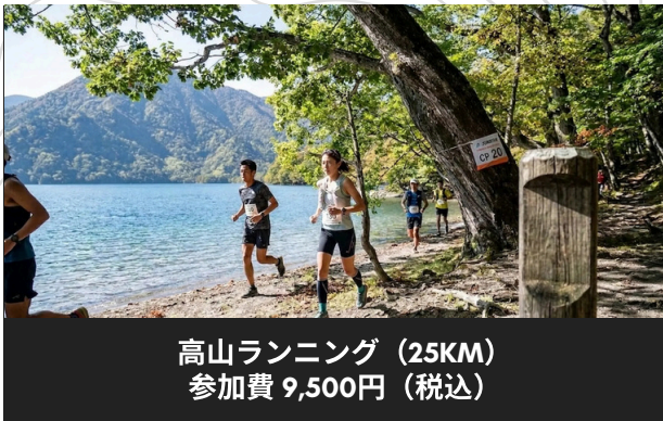
高山ランニング (25KM) 参加費 9,500円 (税込)