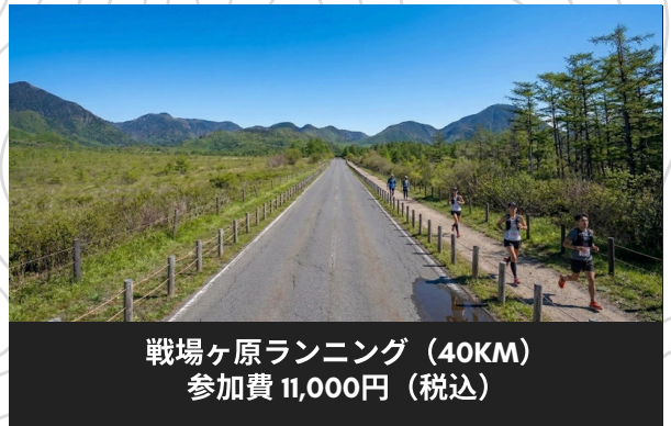
戦場ヶ原ランニング (40KM) 参加費 11,000円 (税込)

日光国立公園の象徴である「中禅寺湖」を舞台に、豊かな自然と歴史を五感で体感するラン&ウォークです。ラムサール条約湿地を含む貴重な生態系への理解を深め、自然保護とスポーツの共生を目指します。標高1,269Mの清涼な空気の中で心身をリフレッシュし、奥日光の新たな魅力を世界へ発信します。